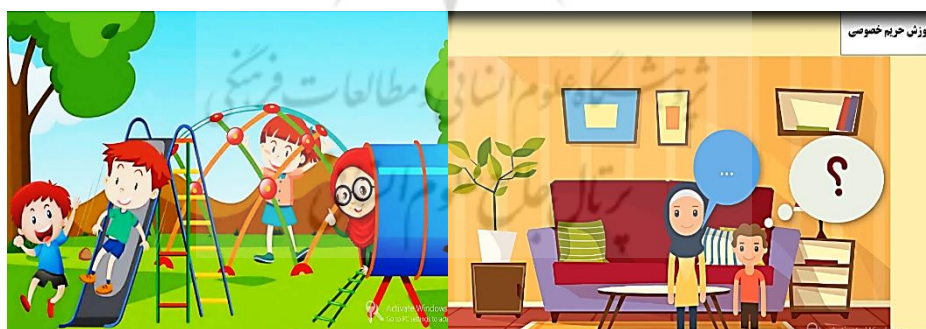
شکل ۲. نمایی از چندرسانه‌ای آموزشی

محتوای تهیه شده ابتدا به صورت متن در اختیار سه محقق حوزه تربیت کودک، قرار داده شد و بعد از دریافت بازخوردها و اصلاح متن به صورت خوانش (گفتار) در آمده و مجدد توسط سه تن از متخصصان حوزه کودک، مورد بازبینی قرار گرفت. در بخش دوم، طراحی آموزشی محتوا به منظور تهیه سناریوی تولید، بخش بندی و مشخص کردن واحدهای تولید صورت گرفت. در بخش سوم، محتوای چندرسانه‌ای تولید شد. در این بخش پس از نهایی شدن متن، به منظور تهیه بسته آموزشی در قالب چندرسانه‌ای، سناریوی تولید تهیه شد. تصاویر و المان‌های تصویری که نشان دهنده مفهوم هر بخش از متن می‌باشد تهیه شده و در قالب نسخه‌ی اولیه در برنامه کماتسیا ۱ چینش شد. برنامه‌ی تولید شده، توسط تیم تولید متشکل از طراح آموزش، متخصص موضوع، گرافیکست و طراح عناصر بصری و تولیدکننده محتوای چندرسانه‌ای، در چهار مرحله مورد بازبینی و اصلاح قرار گرفت و نسخه نهایی آن برای کسب مجوز، اعتباریابی و اجرا در گروه نمونه آماده گردید. پس از کسب مجوز نشر از وزارت فرهنگ و ارشاد اسلامی، محتوا برای انجام فاز بعدی پژوهش در اختیار گروه نمونه قرار گرفت.