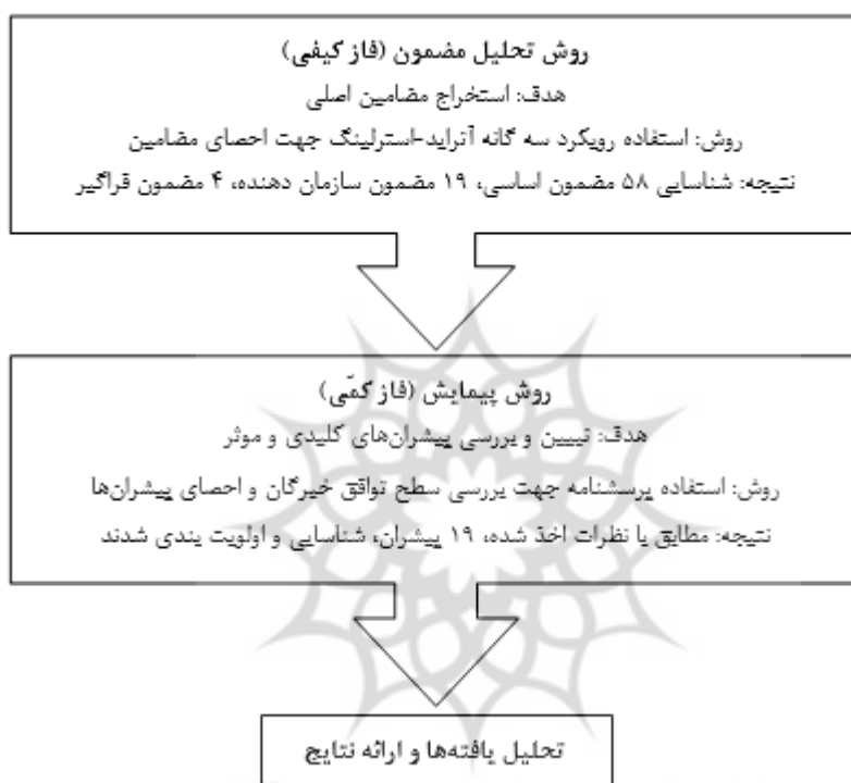
شکل ۲. مراحل روش‌شناسی تحقیق

محاسبه کرد. با نمونه‌های کوچک، مسلماً برآوردهای مقادیر جامعه "کمتر" دقیق خواهند بود و بی‌ثباتی نمونه‌ای در آن به وجود می‌آید. از همین رو، برخی استثنائات وجود دارند که برای نمونه‌های کوچک نیز می‌توان برای آن‌ها محاسباتی به عمل آورد (فاصله اطمینان ۹۵ درصد) (آذر و همکاران، ۱۳۹۱: ۵۴). از میان روستاهای شهرستان سرعین، روستاهای کنزق، کرده ده، ورنیاب، کلخوران ویند، بیله دره و ویلا دره به دلیل مجاورت با این شهر و حضور گردشگران روستایی در فصول مختلف سال انتخاب شدند که هر یک از اطلاعات و داده‌های احصا شده، با در نظرگیری وضعیت و آمار و ارقام دهیاری‌های این روستاها مورد تحلیل و بررسی قرار گرفتند. در ادامه و به صورت خلاصه، مراحل روش‌شناسی تحقیق در شکل ۲ نشان داده می‌شوند.