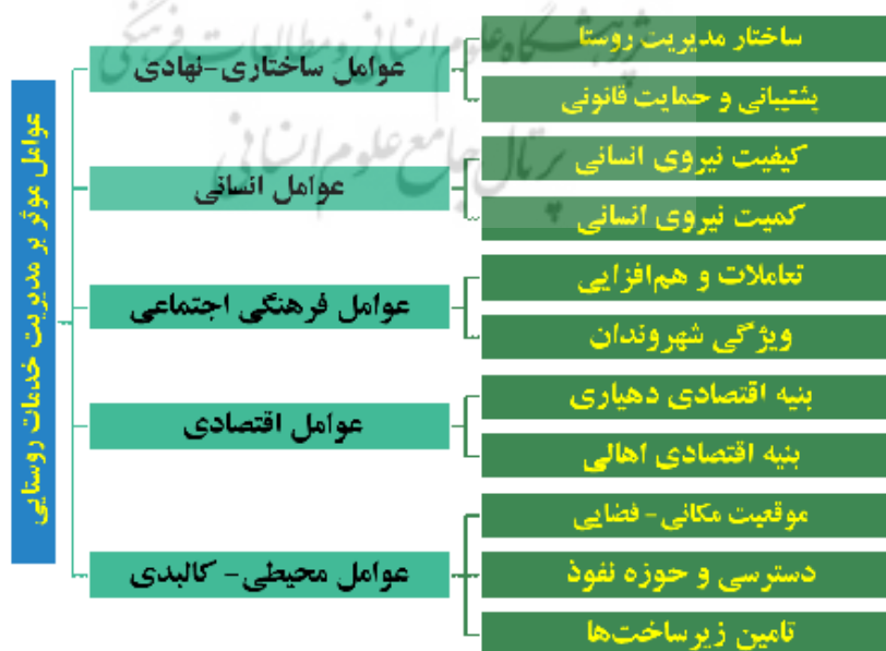
شکل ۵. عوامل مؤثر بر بازآرایی الگوی مدیریت روستایی؛ مولفه‌ها و ابعاد

پس از چند دهه بلا تکلیفی مدیریت روستایی در کشور، شکل‌گیری نهاد دهیاری به عنوان بازوی اجرایی شورای اسلامی روستا، تجربه جدیدی است که حدود دو دهه از آن گذشته است. در حال حاضر نهاد دهیاری تولی‌گری ارایه خدمات عمومی در بیش از ۳۷ هزار روستای کشور را عهده‌دار است. برای بررسی عوامل مؤثر بر بازآرایی الگوی مدیریت روستایی، عوامل بر اساس مبانی نظری و پیشینه تحقیق مورد بررسی قرار گرفت و نتایج در اختیار خبرگان قرار گرفت. عوامل در ۵ بعد شامل؛ ۱- ساختاری نهادی، ۲- انسانی، ۳- اجتماعی فرهنگی، ۴- اقتصادی و ۵- محیطی کالبدی طبقه بندی شد که نتایج در بخش‌های بعدی تجزیه و تحلیل می‌شود. به منظور ارزیابی هر یک از ابعاد پنج‌گانه موصوف و مولفه‌های مرتبط با آنها، ابتدا گویه‌ها هم جهت شد و شاخص کلی محاسبه شد و نتایج با آزمون t تک نمونه مورد ارزیابی قرار گرفت.