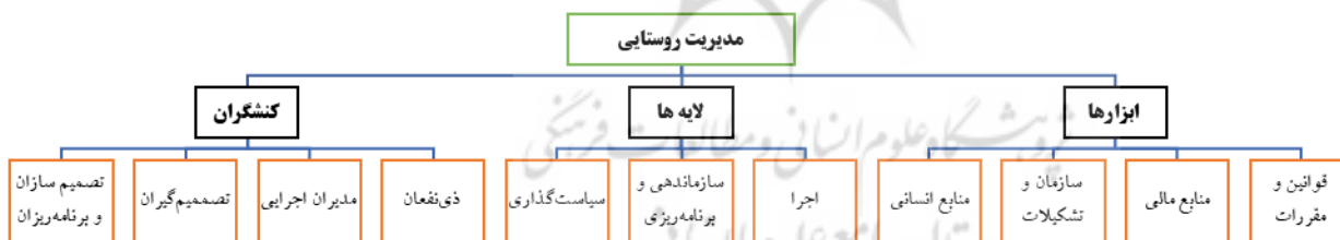
شکل ۱. مدیریت روستایی؛ کنشگران، لایه‌ها و ابزارها

موضوع مدیریت روستایی را باید زیرمجموعه مباحثی نظیر مدیریت توسعه پایدار و مدیریت توسعه روستایی دانست. ضرورت طرح آن نیز از آنجا ناشی می‌شود که روستا به منزله یک اجتماع سازمان‌یافته، نیازمند وجود عنصری برای اداره امور کنونی و برنامه‌ریزی آینده آن است. مدیریت روستایی را نمی‌توان صرفاً حاصل تعامل ساده دهیاری با شورای اسلامی روستا دانست بلکه شامل کنشگران، لایه‌ها و ابزارهای مختلفی است که هر یک از آنها در فرآیند مدیریتی روستا اثرگذار هستند (سوادی علی‌اصغر و همکاران، ۱۳۹۶:۵۷).