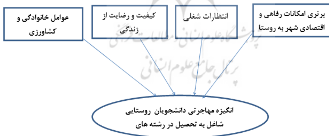
شکل ۲. چارچوب مفهومی تحقیق

بر اساس جمع‌بندی مطالعات پیشین، عوامل مؤثر بر انگیزه مهاجرتی جوانان تحصیل کرده روستایی به شهر یا تمایل به بازگشت آنها به روستا پس از اتمام تحصیلات دانشگاهی در چند بخش شامل عوامل خانوادگی و کشاورزی، انتظارات شغلی، کیفیت زندگی و برتری امکانات رفاهی و اقتصادی شهر به روستا طبقه‌بندی می‌شوند. به‌منظور تبیین و تشریح بهتر موضوع پژوهش، شکل شماره ۱، چارچوب مفهومی تحقیق را نشان می‌دهد که با استفاده از تحقیقات پیشین تدوین شده است.