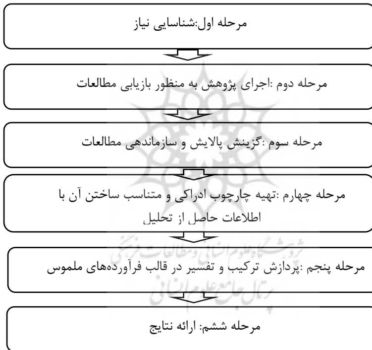
شکل ۱: الگوی شش مرحله ای رابرتس (مارش ۲ ، ۱۳۹۲)

سپس با استفاده از کاربردگر طراحی شده توسط پژوهشگران (پیوست الف)، اطلاعات هر کدام از ۲۴ سند مکتوب، ثبت شد. سپس با استفاده از الگوی شش مرحله-ای سنتز پژوهی رابرتس ۱ (شکل ۱) داده‌ها تحلیل شدند و ویژگی‌های برنامه درسی ریاضی دوره ابتدایی با رویکرد شناختی، استخراج گردید. آنگاه این ویژگی‌ها با ویژگی‌های تبیین شده در پژوهش زادشیر، عصاره، غلام‌آزاد و امام‌جمعه (۱۴۰۱) با هم مقابل شدند که نتیجه آن، طراحی اولیه الگویی برای برنامه درسی ریاضی دوره ابتدایی مبتنی بر رویکرد شناختی بود.