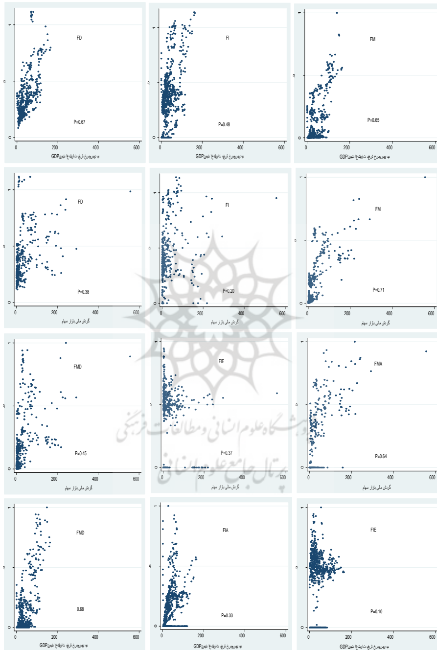
شکل ۲. همبستگی شاخص ترکیبی توسعه مالی با معیارهای سنتی