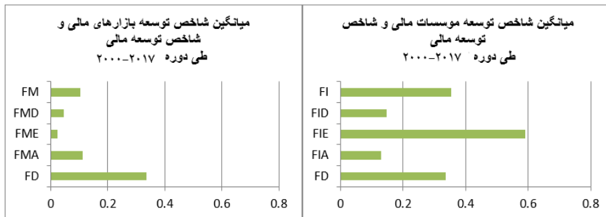
نمودار ۱. میانگین شاخص توسعه مالی و شاخص‌های عمق، دسترسی و کارایی مؤسسات و بازارهای مالی

در ادامه برای اطمینان از پایایی داده‌ها و اجتناب از برآوردهای کاذب، از آزمون ریشه واحد ایم، شین و پسران (IPS) و لوین، لین و چو (LLC) استفاده شده است. نتایج آزمون برای سطح و تفاضل مرتبه اول متغیرهای مدنظر در هر دو گروه در جدول ۴ گزارش شده است. نتایج حاصل از این آزمون نشان‌دهنده عدم وجود ریشه واحد برای بیشتر متغیرها در سطح است. همچنین فرضیه وجود ریشه واحد برای تفاضل مرتبه اول تمامی متغیرها رد می‌شود. در این مطالعه برای آزمون هم‌جمعی از روش ارائه شده توسط کائو استفاده شده است. نتایج حاصل از آزمون هم‌جمعی کائو که در جدول ۵ گزارش شده است، حاکی از رد فرض صفر مبنی بر عدم وجود هم‌جمعی میان متغیرهاست، بنابراین وجود رابطه بلندمدت میان متغیرها تأیید شد و بدون نگرانی از بروز مشکل رگرسیون کاذب، می‌توان مدل را برآورد نمود. سازمان مطالعات فرسنگی