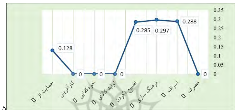
شکل ۳- نمودار ضریب اهمیت مؤلفه‌های اقتصاد مقاومتی در کتاب‌های پایه ششم ابتدایی

بر اساس داده‌های مندرج در جدول ۵ مؤلفه‌های «آموزش و فرهنگ‌سازی در اصلاح الگوی مصرف با ضریب اهمیت ۰,۲۹۷، اسراف نکردن و صرفه‌جویی» با ضریب اهمیت ۰,۲۸۸، «عدم تضييع اموال جامعه» با ضریب اهمیت ۰,۲۸۵، «حمایت از تولید داخلی» با ضریب اهمیت ۰,۱۲۸، در رتبه‌های اول تا چهارم میزان توجه در کتاب‌های درسی پایه ششم ابتدایی قرار داشتند و به مؤلفه‌های «مصرف تولیدات داخلی»، «تولید کالای با کیفیت» و «خودکفایی در تولید محصولات حیاتی»، «کارآفرینی»، با ضریب اهمیت صفر، هیچ توجهی نشده است.