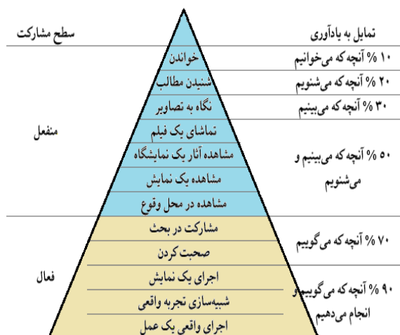
شکل ۱: مخروط یادگیری کری ویکاس (همودا و تارلوچان، ۲۰۱۵: ۱۱).

در روش‌های منفعل یادگیری، یادگیرنده تنها ۵۰ درصد از آنچه که در محیط یادگیری می‌بیند و می‌شنود (۱۰ درصد از آنچه را می‌خواند، ۲۰ درصد از آنچه را که می‌شنود و ۳۰ درصد از آنچه را که می‌بیند) به یاد می‌آورد. این موارد در قالب نقش منفعل یادگیرنده در این هرم بیان شده است. ولی در راهبردهای فعال که یادگیرنده به طور فعالی در یادگیری مشارکت دارد، ۷۰ درصد از آنچه را که می‌گوید و ۹۰ درصد از آنچه را که هم می‌گوید و هم انجام می‌دهد به یاد می‌آورد (مشارکت در بحث، ارائه سخنرانی، اجرای یک نمایش دراماتیک، شبیه‌سازی تجربه واقعی و اجرای واقعی یک عمل). داستان‌سرایی از جمله ابزارهایی است که یادگیری فعال را تقویت می‌کند.