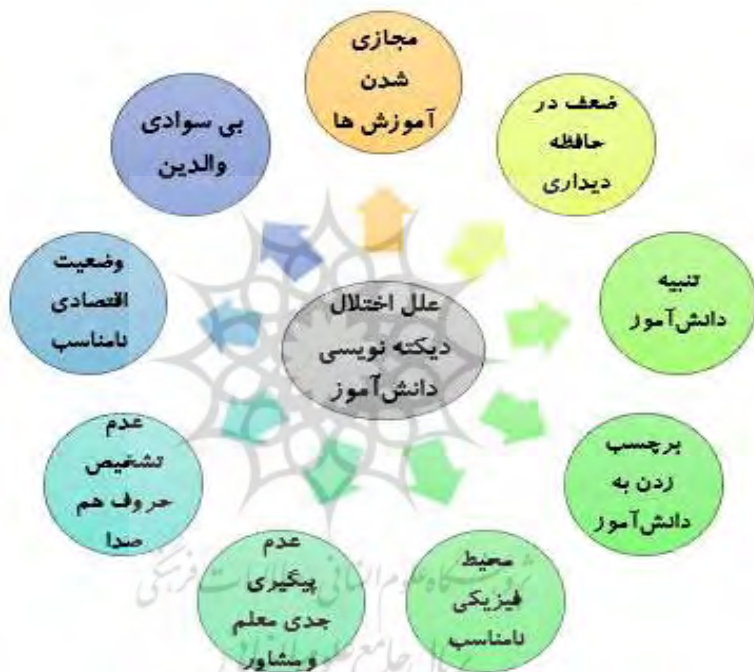
نمودار ۱: بررسی علل اختلال دیکته نویسی دانش‌آموز مورد نظر