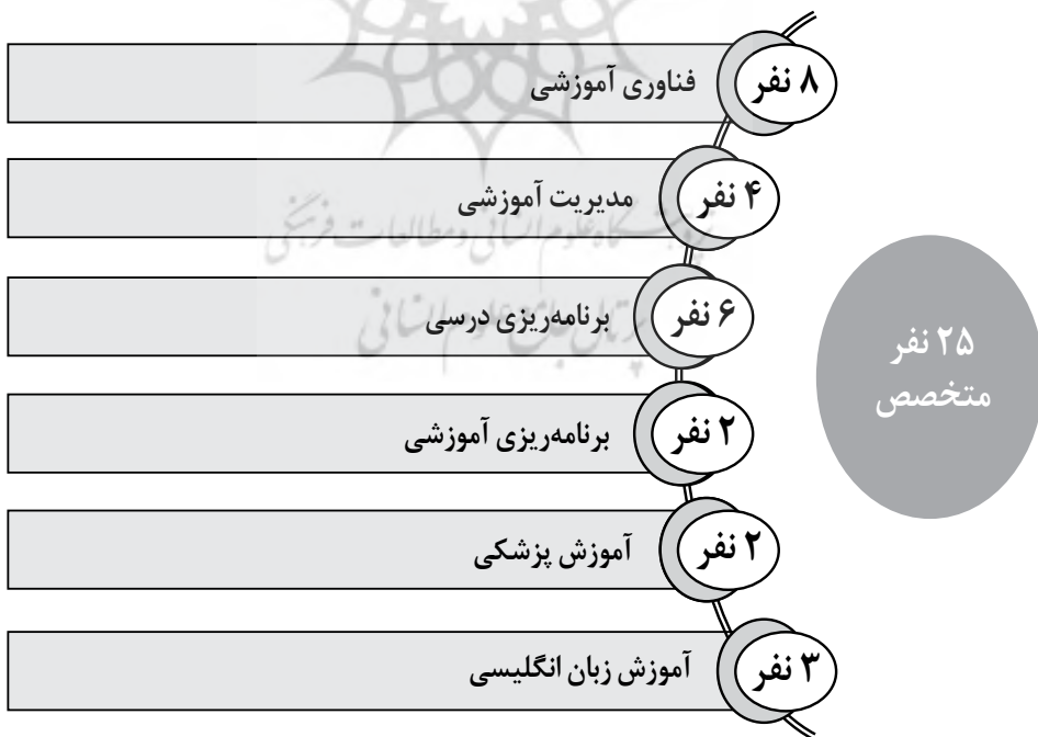
شکل ۲. تخصص جامعه آماری بخش کمی پژوهش

برای اعتباریابی الگو از تحلیل محتوای کمی استفاده شد. به این صورت که ابتدا الگوی اولیه در اختیار استادان راهنما، مشاور و متخصصان حوزه فناوری آموزشی، برنامه‌ریزی درسی، برنامه‌ریزی آموزشی، آموزش پزشکی، پرستاری و زبان انگلیسی قرار گرفت و اصلاحات موردنیاز اعمال شد. سپس برای اعتباریابی درونی الگو از نظر خبرگان، متخصصان و صاحب‌نظران با نمونه‌گیری از میان ۳۲ نفر متخصص که به روش در دسترس و هدفمند انتخاب شده بودند تعداد ۲۵ نفر مشارکت‌کننده به صورت در دسترس و تصادفی تعیین شدند. سپس پرسش‌نامه‌ای با ۲۷ سؤال ۵گویه‌ای مرتبط با مؤلفه‌های الگو با کمک استاد راهنما، استادان مشاور و تعدادی از متخصصان امر به صورت کاغذی و الکترونیکی طرح شد برای اعتباریابی درونی الگوی مفهومی در تأیید مؤلفه‌های اصلی و فرعی اولیه الگو و در اختیار نمونه آماری (۲۵ نفر) قرار داده شد. سپس پرسش‌نامه‌های تکمیل‌شده جمع‌آوری و بازنگری شدند.