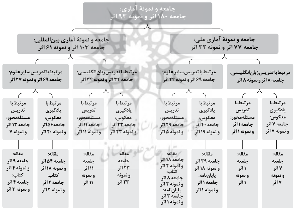
شکل ۱. جامعه و نمونه آماری گروه اول پژوهش

این مطالعات باید تجربی یا مروری باشند و در مجلات معتبر منتشر شده باشند. همچنین در مطالعات انتخاب‌شده باید نحوه طراحی الگوی کلاس معکوس شامل موضوعات، اهداف، قوانین، زمینه، تعاملات و ابزارها همراه با وظایف مربی و فراگیران و اجرای این الگو در محیط‌های آموزشی گزارش شده باشد. در مطالعات انتخاب‌شده باید اطلاعات آماری کافی درباره پیشرفت یادگیری و انگیزه برای محاسبه اندازه اثر مانند میانگین، انحراف معیار و تعداد شرکت‌کنندگان در هر گروه ارائه شده باشد. معیارهای عدم ورود یا خروج در این بخش مربوط به اسناد علمی الکترونیکی و چاپی، گزارش‌های اسنادی، کتاب‌ها، رساله‌ها، پایان‌نامه‌ها و مقالات علمی معتبر بود که در زمینه یادگیری معکوس و تدریس مبتنی بر حل مسئله آن‌هایی که در محیط‌های آموزشی نبودند، خارج از دوره زمانی بودند و زبان آن‌ها نیز به‌جز انگلیسی و فارسی بود از جامعه حذف شدند. اطلاعاتِ وبلاگ‌ها و وبگاه‌ها نیز از روند انتخاب خارج شدند. حجم نمونه تا اشباع نظری داده‌ها ادامه داشت.