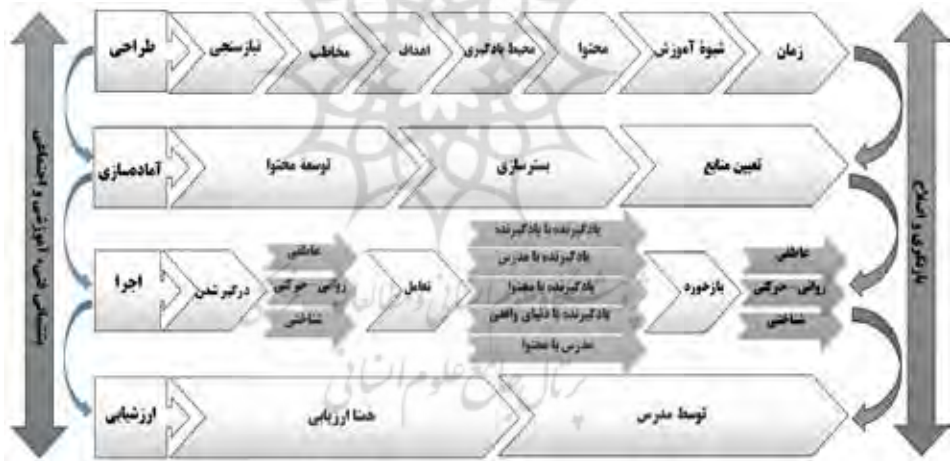
شکل ۵. مراحل تولید محتوا برای اجرای الگو

در این پژوهش برای بررسی اعتباریابی ابزار متغیرهای اصلی پژوهش و مؤلفه‌های آن از شیوه‌های ضریب آلفای کرونباخ و قابلیت اعتماد ترکیبی استفاده شد. برای محاسبه شاخص‌های فوق از رویکرد الگوسازی ساختاری واریانس‌محور استفاده شد. ضریب آلفای کرونباخ و قابلیت اعتماد ترکیبی نشان‌دهنده دقت اندازه‌گیری بالای ابزار زیرمقوله‌های «الگوی یادگیری معکوس مبتنی بر رویکرد تدریس مسئله‌محور» و در نتیجه پایا یا اعتمادپذیر بودن این ابزار است. این موضوع نشان‌دهنده وضعیت مطلوب بارهای عاملی مربوط به همه زیرمقوله‌ها و معرف‌های الگوست. بر اساس این آزمون مشخص شد پرسش‌نامه محقق‌ساخته پایایی قابل‌قبولی دارد. ضریب آلفای کرونباخ و قابلیت اعتماد ترکیبی ۸۳ درصد برای بررسی پایایی به‌دست آمد، لذا حاکی از ارزش و قابل‌قبول بودن ابعاد و شاخص‌های شناسایی شده بود. سپس مراحل تولید محتوا برای اجرای الگو طبق شکل ۵ طراحی شد.