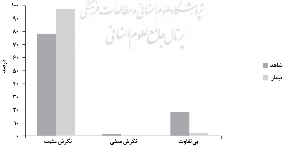
نمودار ۲. ارزیابی عنصر نگرش دانش‌آموزان نسبت به محیط‌زیست و حفاظت از آن

در عنصر نگرش، در گروه شاهد، حدود ۷۸ درصد از دانش‌آموزان در مقابل محیط‌زیست و حفظ آن نگرش مثبت داشتند، ۱۹/۵ درصد از دانش‌آموزان بی تفاوت و ۲/۵ درصد نگرش منفی داشتند. در گروه مداخله و پس از دریافت آموزش ۹۷ درصد از دانش‌آموزان در مقابل محیط‌زیست حساس بودند و به حفاظت از آن نگرش مثبت داشتند و فقط ۳ درصد بی تفاوت بودند (نمودار ۲).