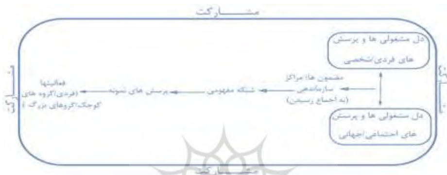
شکل (۲): الگوی تلفیقی بی‌ین (بی‌ین، ۱۹۹۷، ص ۶۰)

جیمز بی‌ین معتقد است که تلفیق واقعی منطبق با الگوی پیشرفت گرایان است که هم به علائق و دل‌مشغولی‌های دانش‌آموزان توجه دارد، هم متوجه مسائل و پروژه‌ها و مباحث اساسی اجتماعی است و همچنین به دموکراسی و نظام دموکراتیک در جامعه تأکید می‌کند (بی‌ین، ۱۹۹۷).