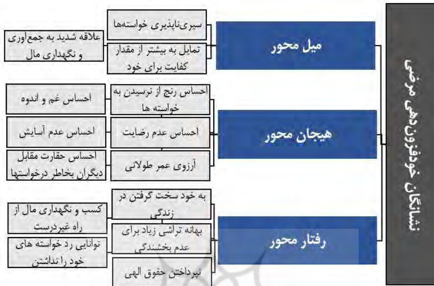
نمودار ۱. مدل مفهومی نشانه‌گان خودفزون‌دهی مرضی بر اساس منابع اسلامی