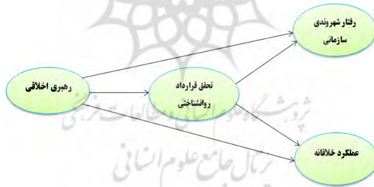
شکل ۱: مدل مفهومی پژوهش

می‌توانند رفتارهای فرانش کارکنان، از جمله رفتار شهروند سازمانی و عملکرد خلاقانه را افزایش دهند. با بررسی‌های انجام‌شده تحقیقی با عنوان مشابه پژوهش حاضر مشاهده نشد. با توجه به اینکه تاکنون چنین پژوهشی در سازمان‌های داخل کشور انجام نشده، ضرورت انجام این تحقیق منطقی به نظر می‌رسد. در این پژوهش ابتدا تأثیر مستقیم رهبری اخلاقی بر رفتار شهروند سازمانی و عملکرد خلاقانه کارکنان و سپس نقش تحقق قرارداد روان‌شناختی را به‌عنوان رابط پیوند دهنده رهبری اخلاقی با رفتار شهروند سازمانی و عملکرد خلاقانه را بررسی می‌کنیم. ادعای ما این است که رهبر اخلاقی با رفتار منصفانه، کارکنان را نسبت به قراردادهای روان‌شناختی قوی بین خود و سازمان حساس‌تر می‌کند که این امر به نوبه خود باعث درگیر شدن بیشتر کارکنان در وظایف فرانش از قبیل رفتارهای خلاقانه و شهروندی سازمانی می‌شود؛ لذا مسئله اصلی پژوهش حاضر این است که رهبری اخلاقی چگونه با میانجی‌گری تحقق قرارداد روان‌شناختی منجر به عملکرد خلاقانه و رفتار شهروندی سازمانی کارکنان دانشگاه بوعلی سینا می‌شود. با توجه به مطالب مطرح‌شده در مقدمه و پیشینه تحقیق، مدل مفهومی پژوهش به شکل زیر ترسیم شده است: