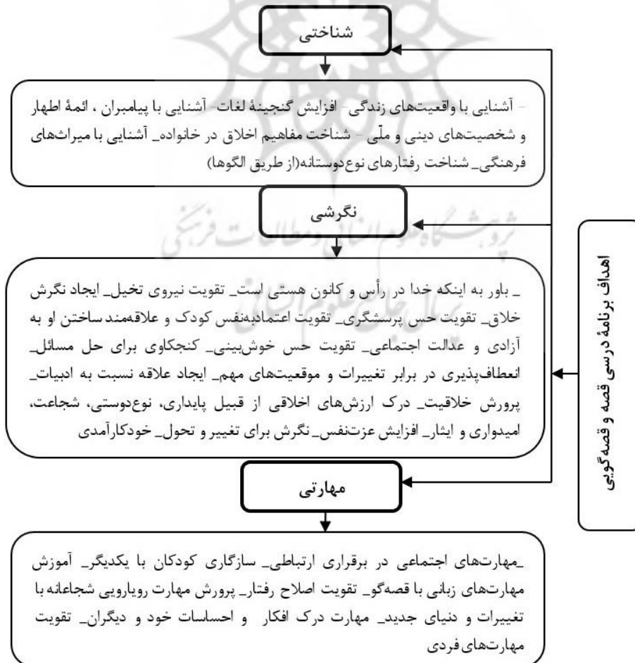
شکل ۱: اهداف برنامه درسی قصه و قصه‌گویی

برنامه درسی قصه‌گویی که از مصاحبه‌ها استخراج شده بود، در سه مقوله اهداف شناختی و نگرشی و مهارتی دسته‌بندی شده‌اند. در شکل ۱ به شرح زیر است: