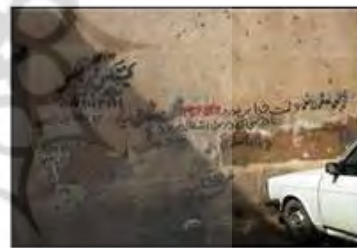
شکل ۵- نمونه‌ای از تخریب زیبایی و زشت نمودن