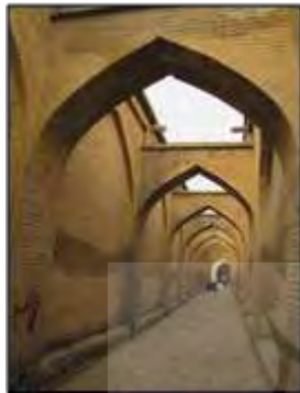
شکل ۱۲- طاق‌ها و قوس‌ها در شهرهای سنتی؛ جلوه‌ای از سیر در معنا و عروج، شیراز، ایران

است از اشکال، احجام، فضاها و مکان‌هایی که این معنی را القا می‌کنند (شکل ۱۲). از نقوش کاشی سردر خانه‌ها گرفته که نمادی از زیبایی بهشت‌اند تا مسجد با گنبد و مناره‌های آن که نمادی از حضور انسان در زیر گنبد آسمان در محضر خداست (شکل ۱۱).