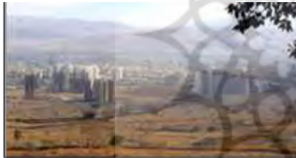
شکل ۱۰- گسست فضایی، پراکنده رویی، پاشیدگی کالبدی و تکه‌تکه بودن شهرهای معاصر، شیراز، ایران

قرار گرفته‌اند و با یکدیگر یک کل واحد را شکل داده‌اند. «ظهور وحدت در یک پدیده (اعم از وحدت بین اجزا آن و وحدت بین آن پدیده با سایر پدیده‌ها و با کل هستی) از مهمترین عواملی است که ظهور آن می‌تواند پدیده را به صفت زیبایی متصف گرداند» (نقی‌زاده، ۱۳۸۶: ۲۹۴). در شهرهای سنتی شهر برآمده از طبیعت بود، نه تحمیل شده بر آن، با آن در تعامل سازنده بود و جزئی تکمیل‌کننده به حساب می‌آمد. دیگر اینکه در خود شهر نیز، اجزای مختلف شهر از خانه گرفته تا خیابان‌ها و میدان، بازارها و مساجد، هیچ‌کدام بدون ربط و پیوستگی از هم نبودند و هرکدام در عین استقلال در یک پیوستگی معقول، کلیت و وحدتی را به نمایش می‌گذاشتند (شکل ۹). ولی شهرهای امروزی تکه‌تکه و ناپیوسته‌اند و به صورت یک کل واحد درک نمی‌شوند (شکل ۱۰). ارتباط آن‌ها با طبیعت نه تنها ارتباط یگانه‌تنی نیست که ارتباطی تخریب‌گرایانه است و نوعی نگاه چیره‌جویانه و تسلط‌طلبانه بر طبیعت دارند که این در تضاد با وحدت کلیه اجزای عالم هستی است.