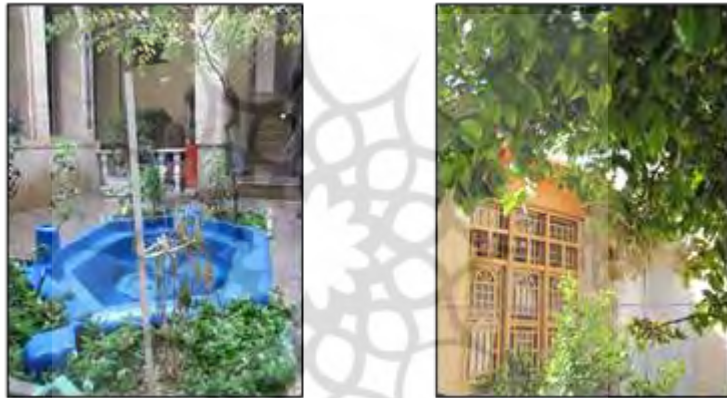
شکل ۱۴- جلوه‌هایی از حضور طبیعت و طراوت در خانه‌های سنتی، شیراز، ایران

«یکی از اصلی‌ترین عوامل تعریف‌کننده زیبایی، وجود حیات است. به همین دلیل است که یک شاخه گل طبیعی از تصویر آن زیباتر است» (همان). حضور انسان و طبیعت در محیط‌های شهری خود منشأ سرزندگی و حیات است چون شهر واجد روح می‌شود. در شهرهای سنتی حضور انسان و طبیعت مانند آب، درخت و... به‌عنوان عناصر زنده و ذی‌حیات به محیط حیات و زندگی می‌بخشد (شکل ۱۴)، حتی احجام بی‌جان به دلیل معانی متعالی که در خود مستتر دارند و به سوی حی لایموت اشاره دارند، واجد حیات انگاشته می‌شوند.