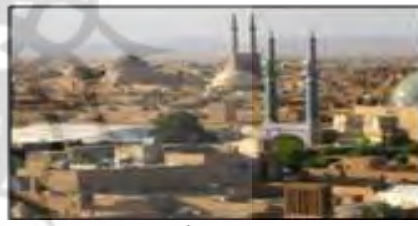
شکل ۹- انسجام، یکپارچگی و پیوستاری شهرهای تاریخی جلوه‌ای از ظهور وحدت، یزد، ایران