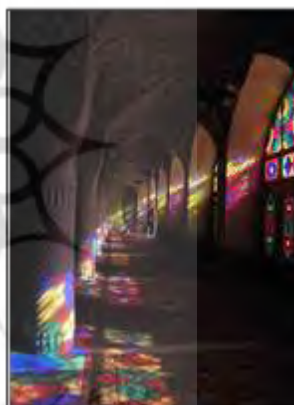
شکل ۱۵- نمونه‌ای از کاربرد نور و رنگ در مساجد شکل ۱۶- نمونه‌ای از کاربرد رنگ در کاشی کاری‌ها و نماهای شهری