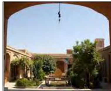
شکل ۱- نمونه‌ای از ترکیب حوض، درخت و تخت در خانه‌های سنتی، یزد، ایران