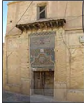
شکل ۱۸- جلوه‌ای از آگاهی‌بخشی و تذکردهی در نماسازی خانه‌های سنتی و فرم‌های هندسی بازارهای ایرانی، شیراز، ایران

آکنده در شهر، حتی در بازارها به‌عنوان مادی‌ترین فضاها و اماکن شهری، نقوش و فرم‌هایی به کار می‌رفت که انسان را به فانی بودن این دنیا و لزوم توجه به سرای باقی متذکر می‌گردید (شکل ۱۸).