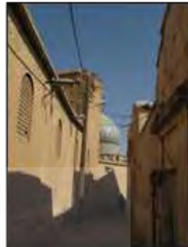
شکل ۱۱- گنبد، عنصر مسلط در شهرهای سنتی و نمادی از تجرد و معنویت، شیراز، ایران

در شهرهای سنتی احجام و فرم‌ها انسان را به‌صرف تماشای خویش دعوت نمی‌کردند، انسان با نگریستن در آن‌ها معنایی از حقایق را درک می‌کرد و آن‌ها وسیله‌ای بودند برای شناساندن مفاهیم متعالی، اما شهرهای امروزی سرشارند از فرم‌ها، اشکال و احجام مجسمه‌واری که به خویش، به‌مثابه یک بت، فرامی‌خوانند و نگاه انسان را از عالم افلاک به عالم خاک محدود می‌کنند و او را بیشتر به عالم مادیات گره می‌زنند (شکل ۱۳).