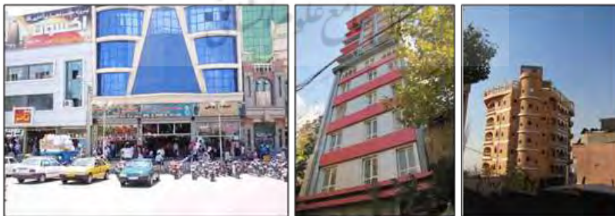
شکل ۱۳- نمونه‌هایی از احجام و فرم‌های مجسمه‌وار و دعوت‌کننده به عالم ماده، مشهد و تهران، ایران نشریات علمی دانشگاه جامع امام حسین (علیه‌السلام)

در شهرهای سنتی احجام و فرم‌ها انسان را به‌صرف تماشای خویش دعوت نمی‌کردند، انسان با نگریستن در آن‌ها معنایی از حقایق را درک می‌کرد و آن‌ها وسیله‌ای بودند برای شناساندن مفاهیم متعالی، اما شهرهای امروزی سرشارند از فرم‌ها، اشکال و احجام مجسمه‌واری که به خویش، به‌مثابه یک بت، فرامی‌خوانند و نگاه انسان را از عالم افلاک به عالم خاک محدود می‌کنند و او را بیشتر به عالم مادیات گره می‌زنند (شکل ۱۳).