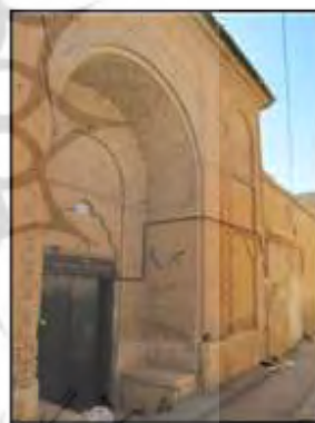
شکل ۳- نمونه‌ای از ایجاد سکو و پیرنشین سایه‌دار در ورودی خانه‌های سنتی، شیراز، ایران

استفاده از رنگ‌های زیبا و سرور آفرین و متعالی مانند سبز زمردی و آبی لاجوردی در کاشیهای سردر خانه‌ها و مساجد تا ایجاد باغ‌های سرسبز و زیبا. آنها با سنگ‌فرش خیابان‌ها و مسیرها هدف خلقت راه‌ها، یعنی هدایت را به نمایش گذاشتند و آسمان شهرشان را به زینت روشنائی چراغ‌ها آراستند. «در زمانی که شب‌ها حتی یک چراغ روشن در خیابان‌های شهر لندن وجود نداشت و در خیابان‌های شهر پاریس نیز حتی تا قرن‌ها بعد اثری از سنگ‌فرش به چشم نمی‌خورد، خیابان‌ها و معابر