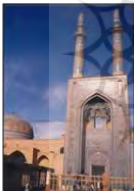
شکل ۴- جلوه عالی‌ترین درجه خلق زیبایی و تعالی کالبدی در طراحی مسجد، یزد، ایران