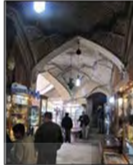
شکل ۱۷- جلوه‌ای از آگاهی‌بخشی و تذکردهی در نماسازی خانه‌های سنتی و فرم‌های هندسی بازارهای ایرانی، شیراز، ایران