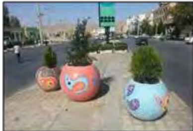
شکل ۸- عناصر تزئینی کم‌دوام و منفک از زمینه که صرفاً به صورت عامل تزئین ظاهری به کار رفته‌اند، شیراز، ایران