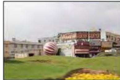
شکل ۷- عناصر [لمان] فرمالیستی و فاقد عمق معنایی در «زیباسازی» شهر معاصر، شیراز، ایران