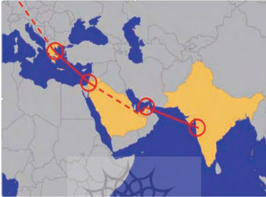
نقشه ۱. مسیر عبوری راه‌گذر عرب‌مدیترانه