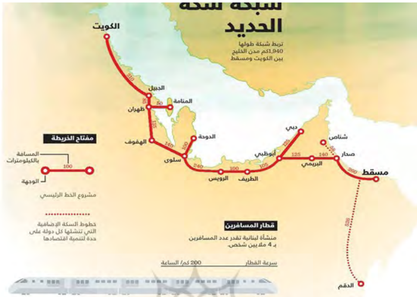
نقشه ۲. مسیر خط ریلی «خلیج» که از بندرهای عمان و امارات به عربستان می رسد