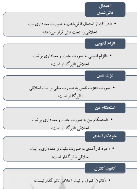
شکل (۲). فرضیه‌های تبیینی پژوهش