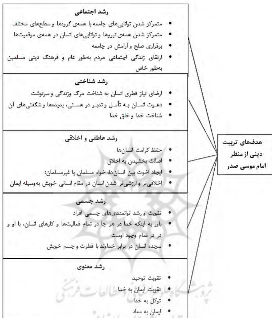
شکل ۱. مدل مفهومی تحقیق