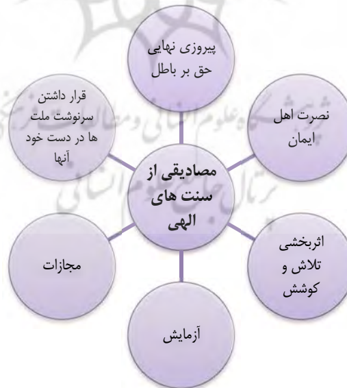
شکل شماره (۲): مصادیقی از سنت‌های الهی

رهبر معظم انقلاب اسلامی در مباحث قرآنی خود و در خلال بحث درباره آیات مختلفی از کلام الله، به سنت‌های گوناگونی از جمله پیروزی نهایی حق بر باطل، نصرت اهل ایمان، اثربخشی تلاش و کوشش، آزمایش، مجازات و قرار داشتن سرنوشت ملت‌ها در دست خود آنها اشاره کرده و به تبیین و تشریح هرکدام از آنها پرداخته است.