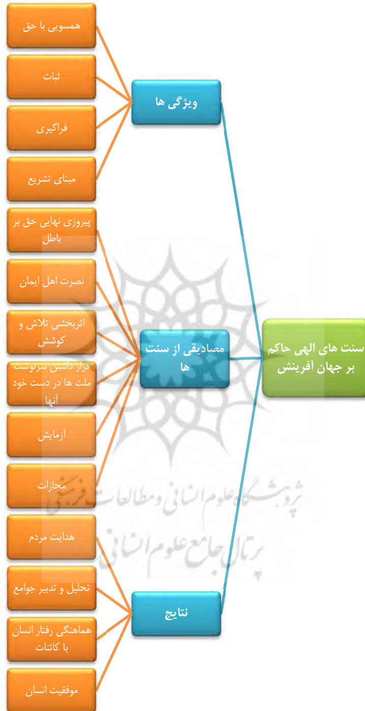
شکل شماره (۵): شبکه مضامین سنت های الهی حاکم بر جهان آفرینش مبتنی بر آثار قرآنی رهبر معظم انقلاب