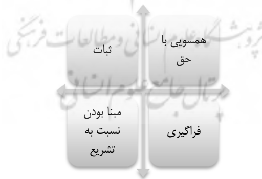
شکل شماره (۱): ویژگی‌های سنت‌های الهی

مبتنی بر اندیشه تفسیری رهبر انقلاب، جهان آفرینش، هرگز به صورت عبث و بی‌هدف خلق نشده، بلکه این عالم با هدف رشد و سعادت انسان و تقرب وی به پروردگار عالم آفریده شده است. سنت‌های الهی، در واقع قواعد و قوانینی بنیادین حاکم بر جهان آفرینش محسوب می‌شوند. این قوانین بنیادین واجد چهار ویژگی اصلی همسویی با حق، ثبات، فراگیری و مبنا بودن نسبت به تشریح می‌شود