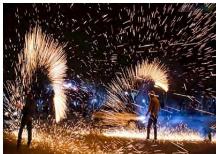
شکل ۹.

مناسک سکولار: در عکس سمت راست، یک کیک قرار دارد و جشن طلاق برجسته شده است. یک بیت شعر در بالای کیک وجود دارد که رهایی از دست دلبر شیرین را به استهزا می‌گیرد. در اینجا از طلاق آشنایی‌زدایی شده است. یک پدیده تراژیک به یک پدیده کمیک و شادی آور بدل شده است. کیک بزرگ در میهمانی‌ها سفارش داده می‌شود. این میهمانی یک آیین برای رهایی از ازدواج است. در پی نوشت این مقاله عکس سمت چپ تحلیل شده است. هر دو عکس به مناسک سکولار تعلق دارند. رسومی که به نظر می‌رسد در طبقات بالای جامعه در حال گسترش است. رسومی چون جشن طلاق، جشن دندان، پدرخواندگی، جشن دندان و جشن پی پی نمونه‌ای از این دست هستند. سوژه‌ی سرسپرده به مناسک سکولار به‌لحاظ فرمی آیین متفاوتی را نسبت به مناسک دینی اجرا می‌کند اما به‌لحاظ ساختاری محصول آیین محسوب می‌شود.