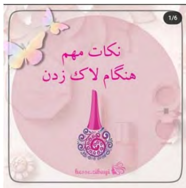
شکل ۳. instagram/hesse.zibayi

بازنمود فردیت در فضای مجازی: ... (احسان آقابابایی و جمال محمدی) ۱۷