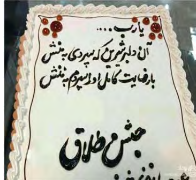
کیک جشن طلاق به نقل از: https://persianv.com