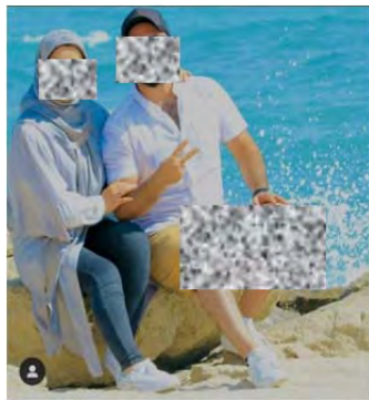
شکل ۲. instagram/maedemoradi2

والدین را پایه و اساس ازدواج می‌دانند و ۵۵ درصد افراد، عشق را ملاک مهمتری ارزیابی کرده‌اند. تأخیر در ازدواج یعنی بالا رفتن سن ازدواج (جنادله و رهنما، ۱۳۹۴)، ظهور الگوهای جدید روابط بین زن و مرد مثل ازدواج سفید، افزایش خانواده‌های تک فرزند و کاهش باروری در بسیاری از استان‌های ایران به دلیل رشد فردگرایی (رستگارخالد و محمدی، ۱۳۹۳؛ صادقی، ۱۳۹۵؛ شاه آبادی و همکاران، ۱۳۹۲) نشان می‌دهند که فردیت در انتخاب در ایران افزایش یافته است.