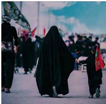
شکل ۷.

مناسک کربلا مناسک هویتی قبیله شیعه است و امام حسین (ع) شخصیت اصلی آن است. مومنان در مناسک مربوط به آن و به‌واسطه سرایت تقدس اسن توتوم و نمادهای آن در اجرای برگزاری مناسک در این تقدس شریک می‌شوند و خویشتن دینی‌شان را که همان خویشتن اجتماعی‌شان هم هست، همراه تجربه‌ای دینی به‌دست می‌آورند (فیاض و رحمانی، ۱۳۸۶: ۱۱۶).