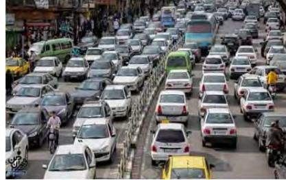
شکل ۱۱.