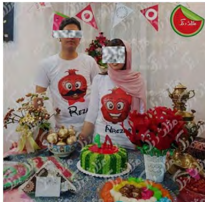
شکل ۸.