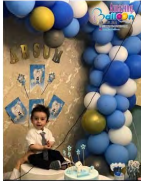
نمونه‌ای از جشن دندان