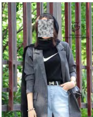
شکل ۴.