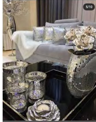
شکل ۱۳.