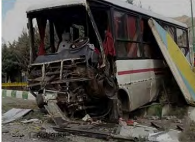
شکل ۱۰.