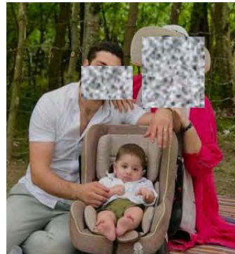
شکل ۱.