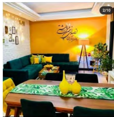
شکل ۵.

در عکس سوم، ابژه یک لاک است و نکات آرایش کردن در واقع نکات لاک زدن را تبلیغ می‌کند. رمزگان حاکم بر این عکس‌ها مبتنی بر بدنمندی و فردیت است. در ایران دهه ۱۳۹۰ با افزایش سطح تحصیلی افراد به مدیریت بدنی خود اهمیت بسیار می‌دهند. درحالی که «ست کردن» در نسل‌های گذشته معنای چندانی نداشت امروزه افراد سعی دارند که لباس‌های متمایز بپوشند، سرووضع خود را مرتب کنند، ادکلن مناسب بزنند و نمایش مقبولی از خود ارائه دهند. آنان برای این نمایش لنز می‌زنند، از لوازم آرایشی بسیار استفاده می‌کنند، از جراحی بینی، پروتز و بوتاکس واهمه‌ای ندارند. تحقیقات در ایران از این موضوع پرده برداشته‌اند که بدن یک امر فرهنگی فردی شده است. اهمیت دادن به تناسب اندام در میان زنان (فاتحی و اخلاصی، ۱۳۸۷)، فراگیر شدن جراحی زیبایی در میان