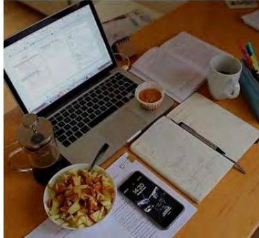
شکل ۱۲. instagram/konkooriha_