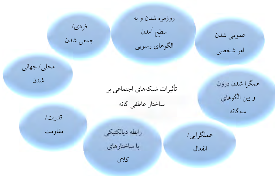
نمودار ۴. پیامدهای نهایی تأثیر شبکه‌های اجتماعی بر ساختار عاطفی ایرانی