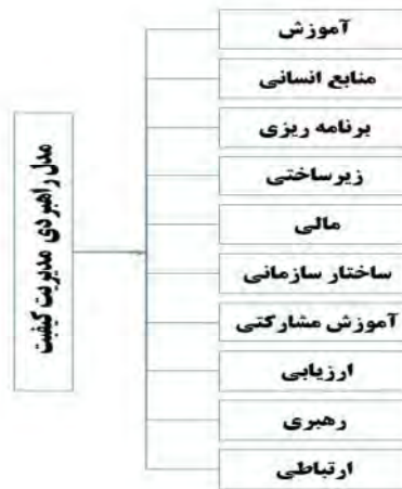
شکل ۱. مدل راهبردی مدیریت کیفیت به منظور اجرای اهداف تربیتی سند تحول بنیادین آموزش و پرورش

کدهای محوری پژوهش حاضر در واقع همان مقولات مستخرج شده در مرحله کدگذاری باز می‌باشند (کرسول، ۱۳۹۶)؛ بنابراین مدل پژوهش در شکل ۱ نشان داده شده است: