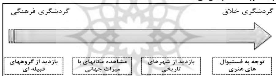
نمودار ۱- از سیر و گردشگری فرهنگی در شهرهای خلاق- مأخذ: (king,2011)

گردشگری فرهنگی، توسعه ی گردشگری است که ساختارهای اجتماعی و اقتصادی بیش از اشکال سنتی گردشگری فرهنگی، مناسب شود در حالی که گردشگری فرهنگی، تا حد زیادی بر مبنای تبادل سرمایه های فرهنگی و اقتصادی مرتبط با رشد اقتصاد نمادین است، گردشگری فرهنگی حتی به اشکال انعطاف پذیرتر با مبادله ی سرمایه ی اجتماعی، عقلانی و فکری در داخل شبکه ها مرتبط می شود. دامنه ی رو به رشد گردشگری فرهنگی و افزایش تنوع تجربیات ارائه شده، می تواند به رشد جامعه ی شبکه ای معاصر مرتبط شود. همانطور که ساختارهای اجتماعی سنتی با روابط انعطاف پذیرتر جایگزین می گردد، ساخت شبکه ها و جریان اطلاعات، دانش و مهارت داخل این شبکه ها، مهم تر می شود (Rogerson&Booyen,2015:5) در پایان نمودار شماره(۳)؛ روند سیر و حرکت از گردشگری فرهنگی در شهرهای خلاق را به صورت مختصر بیان می کند.