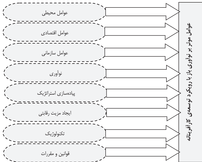
شکل ۱. عوامل موثر بر نوآوری باز با رویکرد توسعه کارآفرینانه