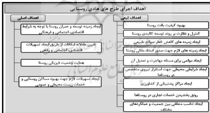
شکل ۱.

با توجه به رویکرد توسعه پایدار، اهداف اجرای این طرح ها در چهار بعد قابل تعریف و طبقه بندی می باشند (فروزش، ۱۳۶۸، ۱۶):