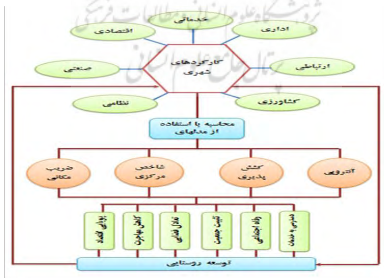
شکل ۱. مدل مفهومی تحقیق (منبع: نگارندگان، ۱۳۹۵)

شهرهای کوچک در شهرستان‌های حاشیه‌ای دارای کارکردهای اداری، خدماتی (آموزشی، بهداشتی، ارتباطی)، اقتصادی، صنعتی، نظامی، کشاورزی می‌باشند که باعث دسترسی به خدمات، رفاه اجتماعی، تثبیت جمعیت، تعادل فضایی، کاهش مهاجرت، پویایی و رشد اقتصادی برای مناطق روستایی می‌گردد و می‌تواند محرک مهمی برای کارکردهای شهری باشد زیرا بیشتر عوامل تولید از امکانات شهری بهره‌مند بوده و خدمات مورد نیاز جامعه روستایی نیز از مراکز شهری به‌دست می‌آید. برای دسترسی روستاییان بهتر است خدمات مورد نیاز در شهرهای کوچک متمرکز شود تا بتوانند در برابر روستاهای پیرامون خود ایفای نقش نموده و بتوانند در توسعه روستاهای تحت نفوذ خود ارائه خدمات کشاورزی، آموزشی، بهداشتی، درمانی، فرهنگی، ورزشی و اوقات فراغت، شبکه ارتباطی، مالی - اقتصادی و تولیدی اثرات مستقیمی بر جای گذاشته و موجب درآمد، مشارکت جمعی، انگیزه ماندگاری، امید به زندگی و توسعه در روستاها شده و سبب تقویت ارتباط بین روستاهای پیرامون و شهرهای کوچک گردد.