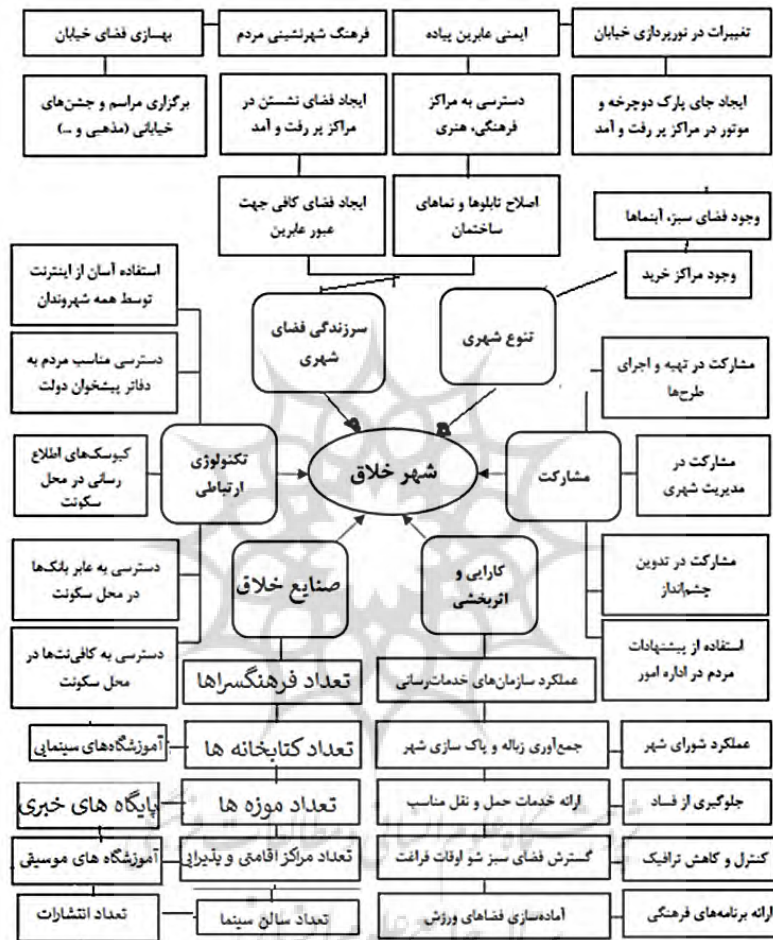
شکل(۱):مدل مفهومی پژوهش براساس ادبیات نظری و پیشینه پژوهش

با توجه به ادبیات نظری پژوهش مدل مفهومی این پژوهش در شکل ۱ نشان داده شده است.