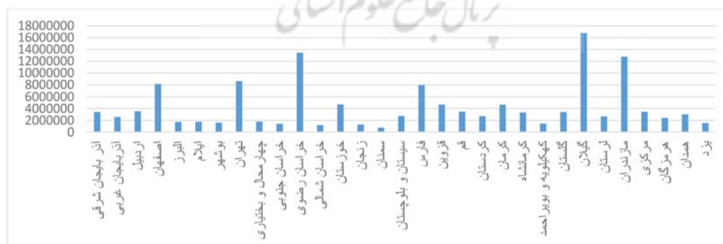
نمودار ۱: متوسط تعداد گردشگران داخلی استان‌ها طی سال‌های ۱۳۹۰ تا ۱۳۹۶

ارقام موجود در جدول (۱) نشان داد که بیشترین تعداد گردشگر داخلی طی سال‌های ۱۳۹۰ تا ۱۳۹۶ در بین ۳۱ استان کشور مربوط به استان گیلان در سال ۱۳۹۱ بوده و کمترین تعداد آن مربوط به استان خراسان شمالی در سال ۱۳۹۰ بوده است. بیشترین و کمترین تعداد گردشگر خارجی نیز طی این سال‌ها در بین استان‌ها مربوط به استان قم در سال ۱۳۹۶ و استان خراسان شمالی در سال ۱۳۹۳ بوده است. بیشترین تعداد اماکن اقامتی طی این سال‌ها مربوط به استان خراسان رضوی در سال ۱۳۹۱ بوده و کمترین تعداد نیز متعلق به استان کهگیلویه و بویراحمد در سال ۱۳۹۰ بوده است. بیشترین تعداد ثبتی جاذبه‌های گردشگری که شامل جاذبه‌های طبیعی و تاریخی و فرهنگی بوده