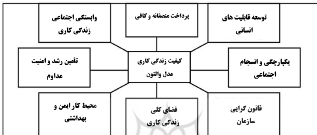
نمودار ۳: هشت بعد ساختار کیفیت زندگی کاری بر اساس مدل والتن (Kanten & Sadullah, 2012)

یکی از کاربردی‌ترین مدل‌های کیفیت زندگی کاری، مدل والتن است که به پرداخت منصفانه و کافی، محیط کار ایمن و بهداشتی، افزایش مداوم امنیت، قانون‌گرایی سازمان، وابستگی اجتماعی زندگی کاری، فضای کلی زندگی کاری، یکپارچگی و انسجام