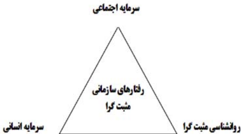
نمودار ۲: عوامل شکل‌دهنده رفتار سازمانی مثبت (Lutansetal., 2004)

تحلیل هر سه سطح فردی، گروهی و سازمانی برای شناخت رفتار در محیط‌های سازمانی لازم است. در جدول ۳ دسته‌بندی مفاهیم، ابعاد مؤلفه‌ها و شاخص‌های رفتار سازمانی در هر سه بعد نشان داده شده است.