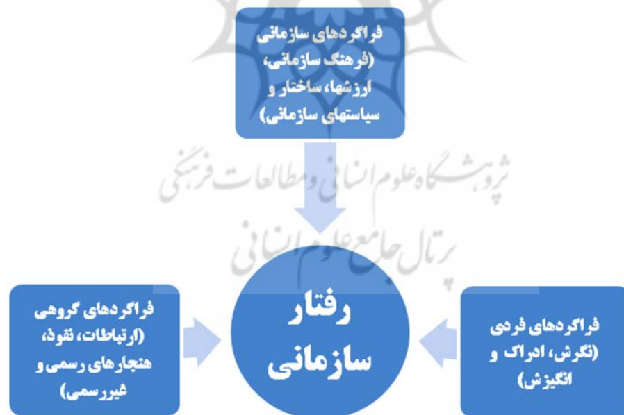
نمودار ۱: الگوی سه‌سطحی تجزیه و تحلیل در رفتار سازمانی (Rezaian, 2001)

بنابر نظریه تناسب فرد - محیط ۱ ، کارکنان محیطی را برای کار انتخاب می‌کنند که با علاقه‌مندی‌ها، ارزش‌ها و اهدافشان همخوانی داشته باشد (Nye et al., 2012). این محیط کاری با نوع سازمان (برای مثال ساختارها و مراتب سازمانی)، به‌عنوان عامل اصلی اثرگذار بر شرایط کاری، ارتباط ویژه‌ای دارد. بنابراین، با مطالعه میزان اثرگذاری کیفیت زندگی کاری بر روی