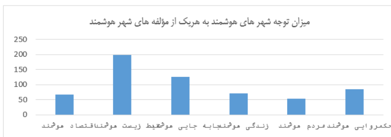
شکل شماره ۱. بررسی میزان توجه به شش مؤلفه شهر هوشمند در شهرهای هوشمند اروپا