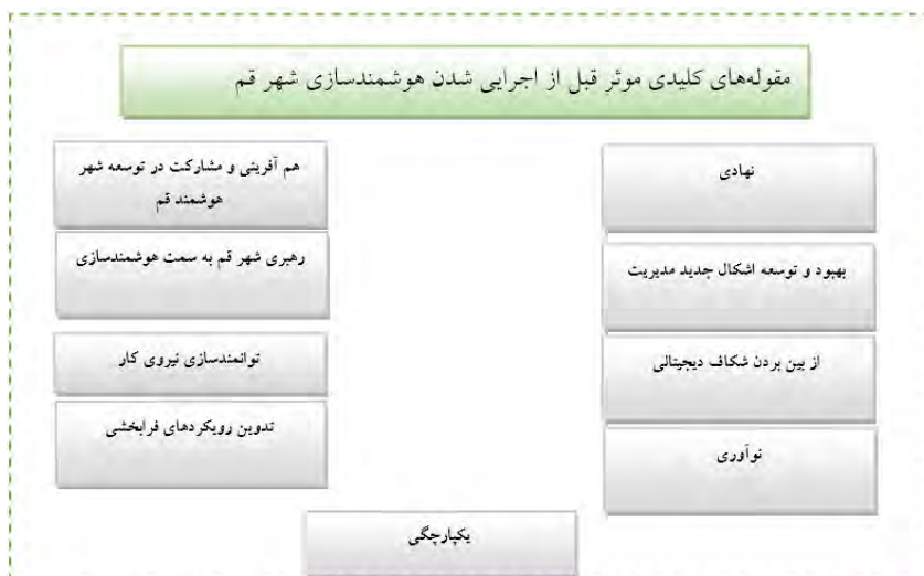
شکل ۲. مقوله‌های کلیدی مؤثر قبل از اجرایی شدن هوشمندسازی شهر قم