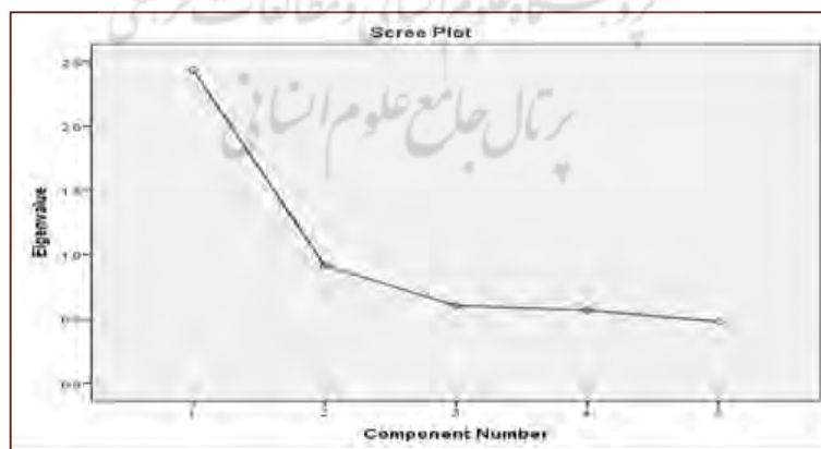
شکل ۳: تغییرات مقادیر ویژه در ارتباط با عامل‌ها

با توجه به شکل ۳، تغییرات مقادیر ویژه مشاهده می‌شود که از عامل اول به بعد تغییرات مقدار ویژه رو به کاهش است (شکل ۳)، پس می‌توان یک عامل را به‌عنوان مهم‌ترین عامل که بیشترین نقش را در تبیین واریانس داده‌ها دارد استخراج کرد (مؤلفه اقتصادی)