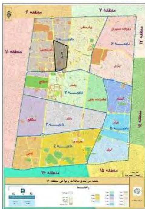
نقشه شماره ۱: نقشه محدوده‌ی مورد مطالعه

همچنین قلمرو زمانی پژوهش حاضر بین سال‌های ۱۳۹۸ تا ۱۳۹۹ میلادی است. قلمرو موضوعی نیز مطالعه بازآفرینی شهری در خیابان لاله‌زار بر اساس رویکرد فرهنگ مینا است.