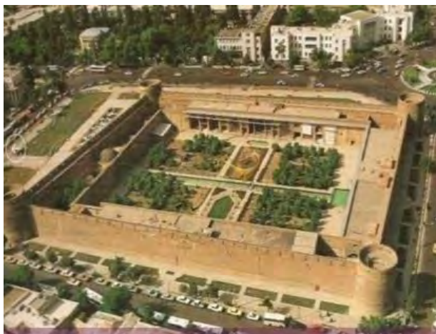
ارگ کریم خان زند

شکل ۲. المان‌های ایرانی اسلامی شهر شیراز