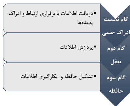
شکل ۱. سه مرحله اساسی فرآیند کسب معنا شامل ادراک حسی، تعقل و حافظه

به منظور تجزیه و تحلیل فعال می‌شود و در نهایت با استفاده از حافظه، به شناخت دست می‌یابد (Krimsky et al, 2017: 84; Mitchell & Phillips, 2015: 5; Karatekin, 2013: 868). مرحله بعدی شناختی، زمانی است که معقولات اولیه، منشأ انتزاع مفاهیم ثانویه هستند. در این الگوریتم، حالت‌های گوناگونی از تطابق تا تناقض، در پارامترها می‌تواند رخ دهد (Carstone, 2016: 156).