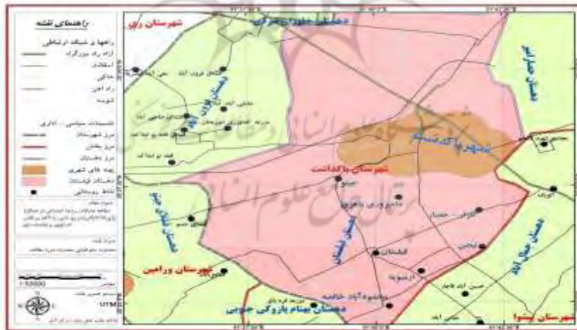
نقشه شماره ۱: موقعیت جغرافیایی روستاهای دهستان فیلستان در شهرستان پاکدشت

شهرستان پاکدشت با وسعتی معادل ۶۱۰ کیلومتر مربع، حدود ۳/۲ درصد از مساحت استان تهران را به خود اختصاص داده و با ارتفاع ۱۰۱۳ متر از سطح دریا در زمین‌های آبرفتی جنوب رشته‌کوه‌های البرز قرار گرفته است. این دهستان، در بخش مرکزی شهرستان پاکدشت واقع شده و شامل روستاهای فیلستان، جیتو، ارمبویه، گلزار (گلزار بالا و پایین)، جمال آباد و محمودآباد خالصه و دو روستای زیر ۲۰ خانوار تیجن و دامپرووری باهری است. جمعیت و خانوار روستاها در جدول شماره ۴ ارائه شده است. فعالیت اصلی روستائیان در این دهستان، کشاورزی و به‌ویژه کشت گلخانه‌ای و کشت گل و گیاهان زینتی است که نسبت به سایر دهستان‌های شهرستان پاکدشت از سطح توسعه مطلوب‌تری برخوردار است.