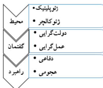
شکل (۲): نمودار روابط محیط، نگرش و راهبرد از منظر سازه‌انگاری

با در نظر گرفتن دو نمودار پیشین از نتایج نظریه‌های مطرح شده و به‌ویژه نظریه‌های سازه‌انگار می‌توان تعامل متغیرهای سه‌گانه را نه یک امر متوقف به نتیجه بلکه پویایی‌های آن را به شکل چرخه‌ای از تعاملات پیوسته، پویا، و بازتولیدکننده، آن‌گونه که سازه‌انگاران مدعی هستند، درک کرد. نمودار زیر این وضعیت را به شکل روشن‌تری نشان می‌دهد: