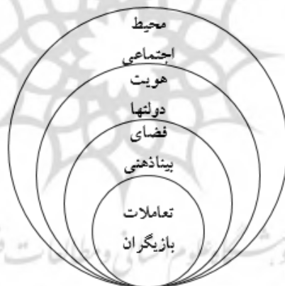
شکل (۱): نمودار شکل‌گیری رفتار دولت‌ها در چارچوب اندیشه سازه‌انگاری

طبعاً نمودار بالا مبتنی بر بحث‌های کلان نظریه‌های برساختی به کلیت محیط و ذهنیت و تعاملات می‌پردازد و برای مباحثی که در بخش‌های بعدی بایستی به آنها پرداخته شود نیازمند مدل تحلیلی ساده‌تری هستیم. از این‌رو، در چارچوب مباحث نظری مطرح شده در فرازهای بالاتر و بر اساس مفاهیم و ایده‌های برگرفته از نظریه‌های محیطی، تعاملی و بویژه نظریه‌های برساختی یا سازه‌انگار علوم انسانی در مورد راهبرد دولت‌ها و با عنایت به مباحثی که در بخش‌های بعد به آنها می‌پردازیم، می‌توان نموداری که روند تاثیرگذاری محیط بر نگرش و تشکیل راهبرد را نشان می‌دهد به شکل زیر ترسیم نماییم: