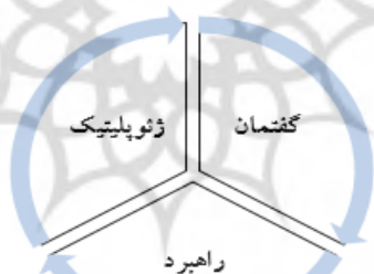
شکل (۳): نمودار چرخه تعاملی شکل‌گیری راهبرد و پیامدهای آن

با در نظر گرفتن دو نمودار پیشین از نتایج نظریه‌های مطرح شده و به‌ویژه نظریه‌های سازه‌انگار می‌توان تعامل متغیرهای سه‌گانه را نه یک امر متوقف به نتیجه بلکه پویایی‌های آن را به شکل چرخه‌ای از تعاملات پیوسته، پویا، و بازتولیدکننده، آن‌گونه که سازه‌انگاران مدعی هستند، درک کرد. نمودار زیر این وضعیت را به شکل روشن‌تری نشان می‌دهد: