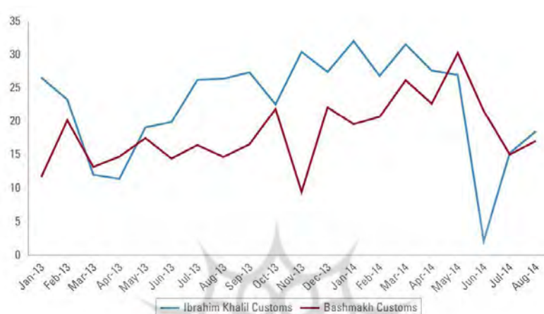
شکل (۴): نمودار مقایسه درآمد دو گمرک ابراهیم خلیل ترکیه و باشماق ایران طی ۲۰ ماه بر حسب دلار (از ژانویه ۲۰۱۳ تا آگوست ۲۰۱۴).