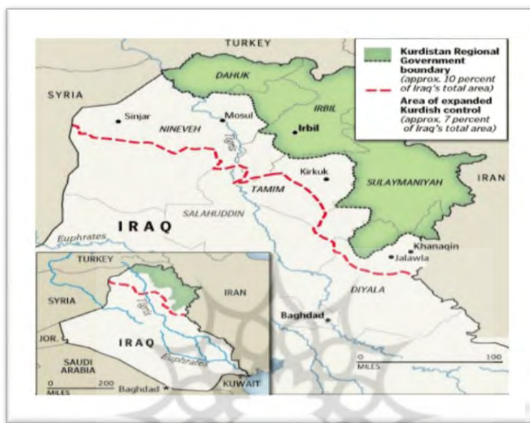
شکل (۱): نقشه دولت منطقه‌ای کردستان و مناطق تحت کنترل