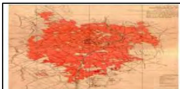
شکل ۲. نقشه بافت تاریخی همدان در سال ۱۳۳۵