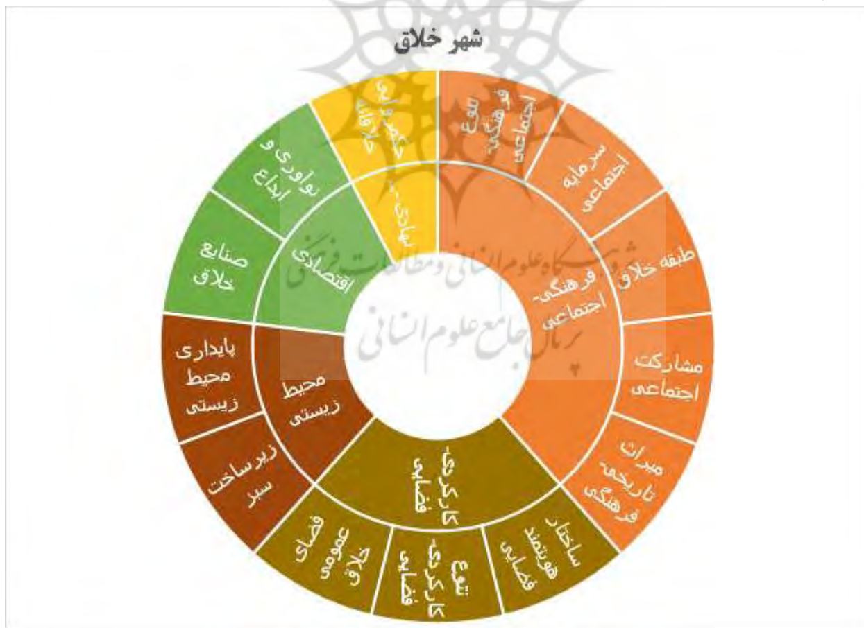
شکل ۳. مدل توسعه شهر خلاق در بافت تاریخی شهر همدان

نبود جامع‌نگری در توسعه بافت‌های تاریخی نظیر رویکردهای کالبدی به این بافت‌ها، عوارض جبران‌ناپذیری در تداوم حیات طبیعی داشته‌است. تجربه نشان می‌دهد تشریک مساعی میان نهادهای اجتماعی و اقتصادی از اولویت‌های توسعه بافت‌های تاریخی است. یکی از همین بافت‌های ارزشمند تاریخی، هسته مرکزی شهر همدان است که به سیاست‌گذاری و برنامه‌ریزی جامع در فرایند توسعه خلاق نیاز دارد. براساس تکنیک تحلیل عاملی اکتشافی و همچنین بررسی متغیرهای مرتبط از منظر پاسخ‌دهندگان، شاخص‌ها در سیزده عامل به‌عنوان بسترهای توسعه شهر خلاق در بافت و هسته تاریخی شهر همدان دسته‌بندی شدند، شامل احیای میراث تاریخی فرهنگی، تقویت مشارکت اجتماعی، توجه به طبقه خلاق، حفظ سرمایه اجتماعی، توجه به جاذبه‌های فرهنگی اجتماعی، ارتقای حکمروایی خلاق، نوآوری و ابداع، صنایع و گردشگری خلاق، پایداری محیط‌زیستی، زیرساخت سبز، جاذبه فضای عمومی خلاق، تنوع کارکردی فضا و ساختار هویت‌مند فضایی.