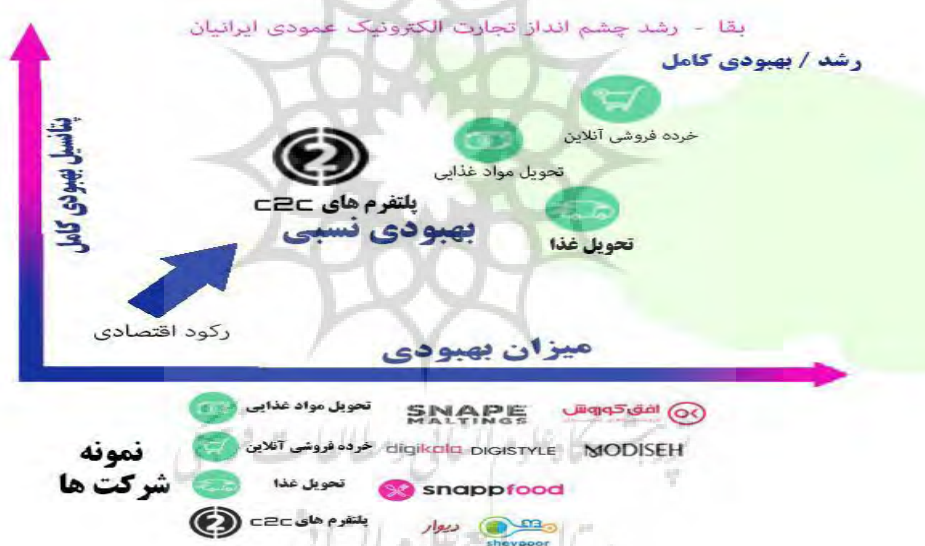
شکل ۱. بقا- رشد چشم انداز تجارت الکترونیک عمودی ایرانیان

بخش تجارت الکترونیک در ایران با شیوع دنیاگیری تغییر شکل داده و خواربارفروشی برخط بیشترین رشد را در این دوران داشته است، هنگامی که چشم انداز بخش تجارت الکترونیک ایران را مورد بررسی قرار می‌دهیم به این موضوع که عوامل موجود (دنیاگیری) بر بقا/بازیابی این بخش تأثیر بگذارد پی می‌بریم ولی در این میان تغییرات رفتار مصرف‌کنندگان تا حد زیادی حیاتی‌ترین عامل تعیین‌کننده برای رشد کامل است.