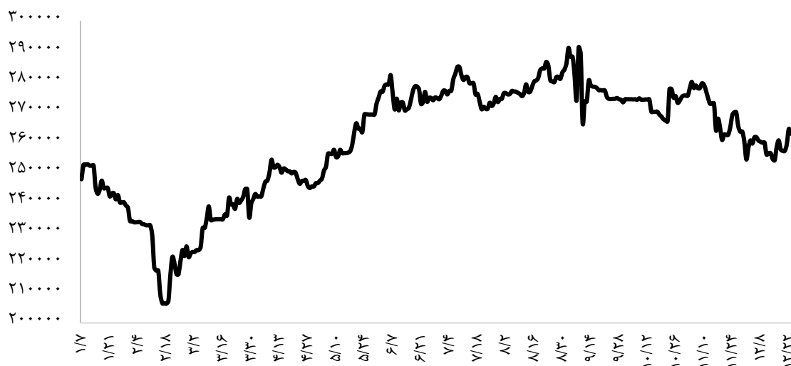
نمودار ۱- روند روزانه نرخ ارز در سال ۱۴۰۰ (ریال)

روند تحولات روزانه نرخ ارز در سال ۱۴۰۰، در نمودار شماره ۱ نشان داده شده است. همان‌طور که در این نمودار مشاهده می‌شود، این متغیر تا اواسط اردیبهشت هم‌زمان با برگزاری منظم جلسات مذاکرات برای بازگشت به برجام و ارائه پالس‌هایی مبنی بر رفع تحریم از برخی منابع ارزی بلوکه‌شده در دیگر کشورها از جمله کره جنوبی و عراق روند نزولی به خود گرفت، اما از اواسط اردیبهشت هم‌زمان با قوت گرفتن احتمال پیروزی اصول‌گرایان در انتخابات ریاست جمهوری و با توجه به رویکرد این جناح سیاسی نسبت به برجام و روند مذاکرات، دوباره روند