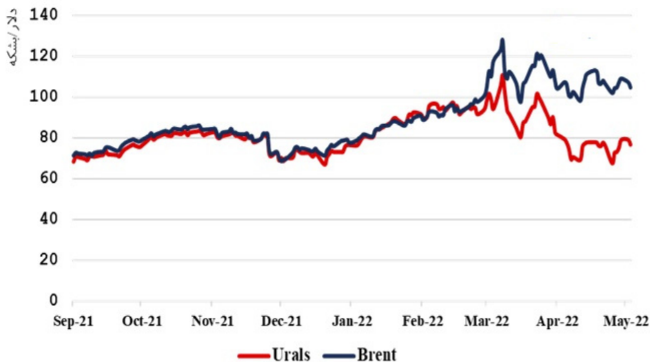
نمودار ۳- روند قیمت با تخفیف نفت روسیه (اورال) در مقایسه با نفت برنت

نزدیکی روسیه و چین در ماه‌های اخیر و امضای قراردادهای همکاری در زمینه انرژی، مسکو را به همکاری نامحدود با پکن در بازار انرژی امیدوارتر کرده است؛ به‌گونه‌ای که از نظر بازار گاز نیز می‌تواند با خط لوله جدید «قدرت سیبری» و وعده‌های چینی‌ها، بخش عمده‌ای از بازار ازدست‌رفته خود در اروپا را بازیابد. هندی‌ها در سال‌های اخیر همواره از منتقدان تحریم نفتی ایران بوده‌اند. با توجه به چرخش آشکار در سیاست