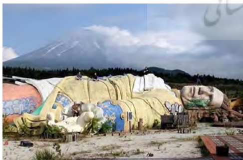
شکل ۲- پارک موضوعی گالیور در ژاپن

هربرت (۲۰۰۱) نیز مکان‌های ادبی را اینگونه دسته‌بندی کرده است: الف) مکان‌های واقعی، ب) مکان‌های خیال‌انگیز، ج) مکان‌هایی که گردشگران را به دلیل احساس عمیق آنها نسبت به یک شخصیت ادبی یا داستان به آنجا جذب می‌کنند و د) محلی که اتفاقات چشمگیر و دراماتیک زندگی یک نویسنده در آنجا اتفاق افتاده باشد؛ مانند مکان مرگ یک نویسنده.