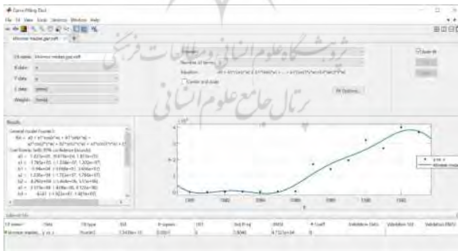
شکل (۳): منحنی برازش خمس معدن و نفت و گاز طی سال‌های ۱۳۸۰-۱۳۹۳

نمودار (۳): نمودار اصلی برای سری داده‌های خمس معدن، نفت و گاز طی سال‌های ۱۳۸۰-۱۳۹۳ مدل به‌دست‌آمده از طریق الگوریتم LOWESS برازش منحنی در نرم‌افزار Matlab به صورت شکل زیر و رابطه پیشنهادی به صورت سری فوریه می‌باشد.