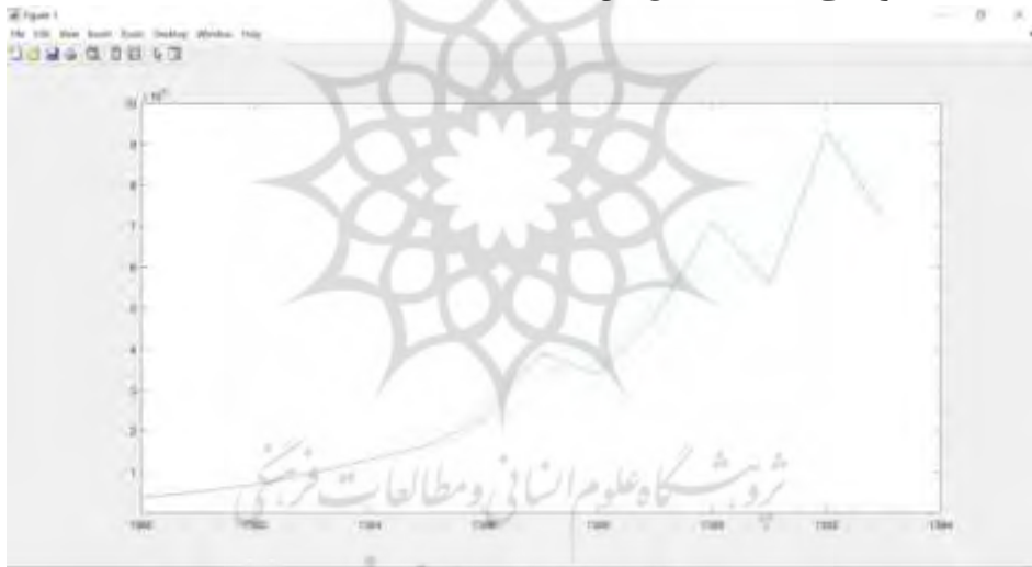
نمودار (۱): نمودار اصلی برای سری داده‌های خمس کل سال‌های ۱۳۸۰-۱۳۹۳

مدل به دست آمده از طریق الگوریتم LOWESS برازش منحنی در نرم افزار Matlab به صورت شکل زیر و رابطه پیشنهادی به صورت سری فوریه می‌باشد.