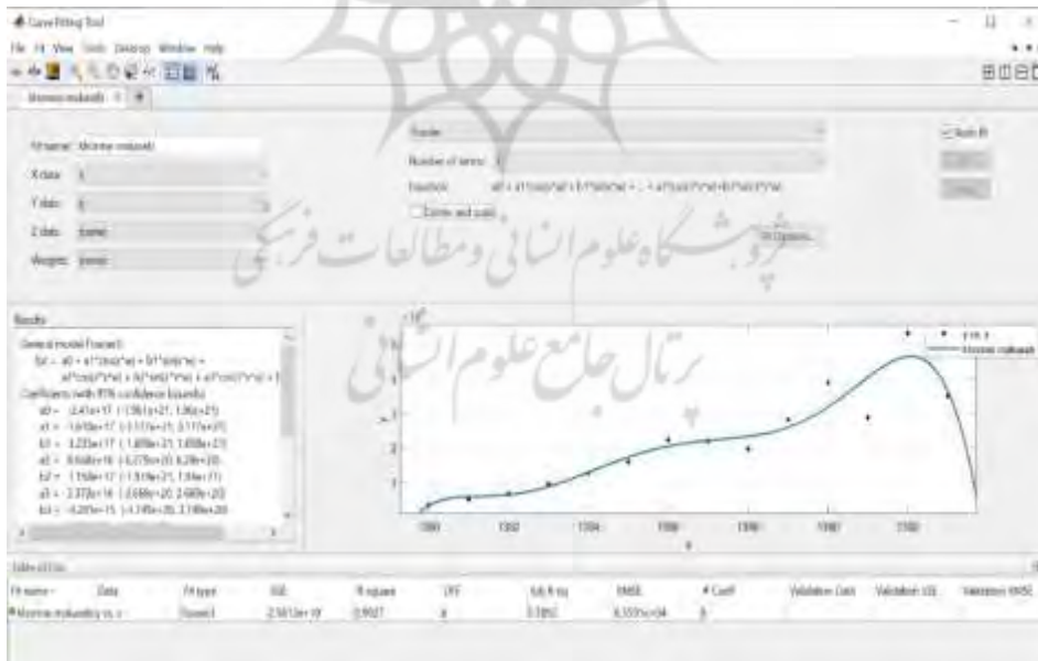
شکل (۲): منحنی برازش خمس درآمد طی سال‌های ۱۳۸۰-۱۳۹۳

مدل به‌دست‌آمده از طریق الگوریتم LOWESS برازش منحنی در نرم‌افزار Matlab به صورت شکل زیر و رابطه پیشنهادی به صورت سری فوریه می‌باشد.