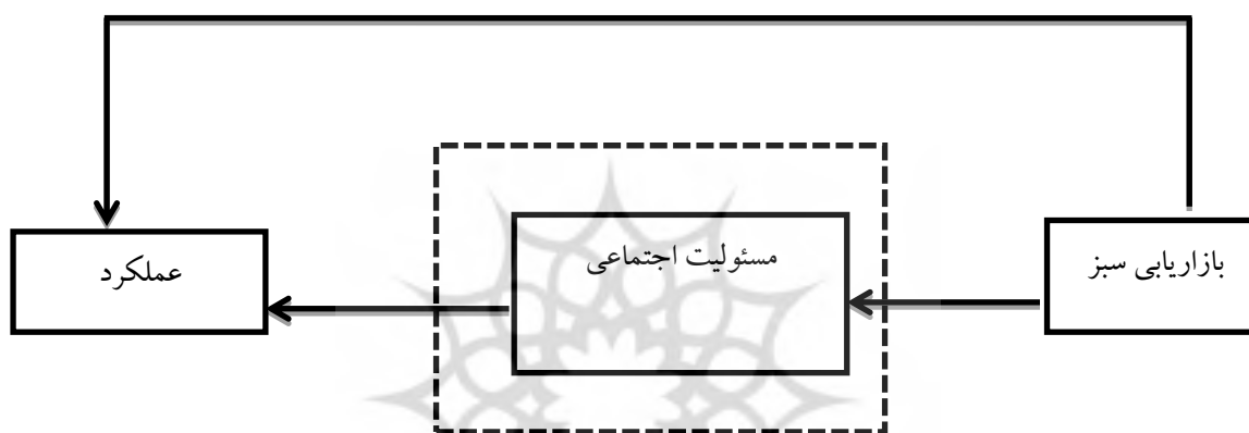
شکل ۱. مدل مفهومی تحقیق

بررسی عوامل اثرگذار بر بهبود عملکرد اماکن ورزشی و ارتقاء سطح خدمات؛ ضرورت می‌یابد تا تحقیقات گسترده و کاربردی به منظور شناخت عوامل مؤثر صورت گیرد. با توجه به مطالب ذکر شده محقق در نظر دارد تأثیر محرک‌های بازاریابی سبز بر عملکرد اماکن ورزشی با میانجی‌گری مسئولیت اجتماعی را براساس مدل مفهومی تحقیق (شکل ۱) مورد بررسی قرار دهد و با استفاده از نتایج پژوهش، پیشنهادات کاربردی را ارائه دهد.