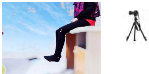
شکل ۴- نحوه ی سنجش حس عمقی مچ پا آزمودنی