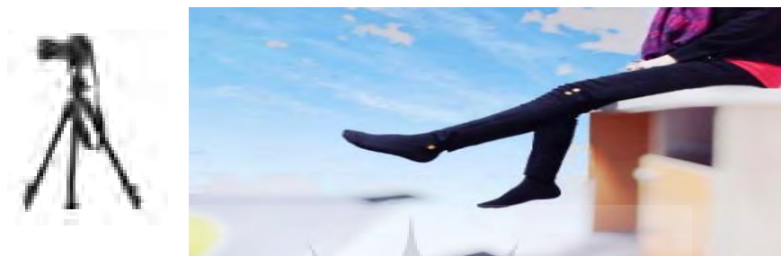
شکل ۳- نحوه ی سنجش حس عمقی زانوی آزمودنی

پایه مخصوص و مطابق با ارتفاع زانوی آزمودنی‌ها بصورت عمود تنظیم شد و تمامی تصاویر از فاصله ۱۸۵ سانتیمتری ثبت شد. پس از انجام آزمون، تصاویر دیجیتال به رایانه منتقل و توسط نرم افزار کینوا، مقدار عددی زاویه مورد نظر محاسبه شد (شکل ۳) (۲۸، ۳۰).