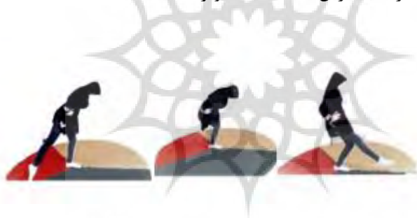
شکل ۱- نحوه ی سنجش تعادل پویا

ارزیابی تعادل پویا: برای اندازه گیری تعادل پویای آزمودنی‌ها از آزمون تعادلی وای استفاده شد. در این آزمون سه جهت (قدامی، خلفی-داخلی، خلفی-خارجی) در یک صفحه مرکزی قرار می‌گیرد. قبل از شروع آزمون پای برتر آزمودنی‌ها تعیین شد تا در صورتی که پای راست اندام برتر باشد، تست در خلاف جهت عقربه‌های ساعت انجام شود و اگر پای چپ پای برتر باشد تست در جهت عقربه‌های ساعت انجام شود. آزمودنی با پای برتر (به صورت تک پا)، در صفحه تلاقی سه جهت می‌ایستد و تا آنجا که مرتکب خطا نشود (پا از صفحه تلاقی سه جهت حرکت نکند، روی پایی که عمل دستیابی انجام می‌دهد تکیه نکند و یا شخص نیافتد) عمل دستیابی را انجام می‌داد و به حالت طبیعی روی دو پا باز می‌گشت و فاصله‌ای را که آزمودنی عمل دستیابی را انجام داده است، به عنوان مقدار دستیابی او ثبت شد. هر آزمودنی هر یک از جهت‌ها را سه بار انجام داد و در نهایت میانگین آنها محاسبه، بر اندازه طول پا (از خار خاصره‌ی قدامی-فوقانی تا قوزک داخلی) برحسب سانتی متر تقسیم شده و سپس در عدد صد ضرب تا فاصله دستیابی برحسب درصدی از اندازه طول پا به دست آید. پایایی تست وای بین ۰/۸ تا ۰/۸۷ درصد گزارش شده است (تصویر ۱) (۲۱، ۲۷).