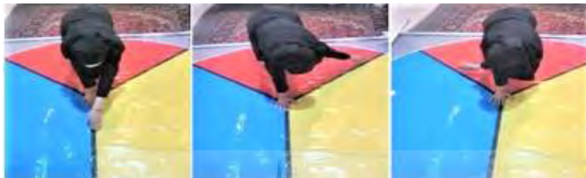
شکل ۲- نحوه ی سنجش تعادل اندام فوقانی

دستیابی با استفاده از طول اندام فوقانی آنها که در برگیرنده فاصله بین زانده خاری مهره هفتم گردنی و بلندترین انگشت دست (در وضعیت ۹۰ درجه دور شدن شانه و باز شدن آرنج، مچ و انگشتان) می‌باشد نرمال‌سازی شد و بیشترین نمره به عنوان نمرهء فرد ثبت شد (شکل ۲) (۲۲-۲۴).