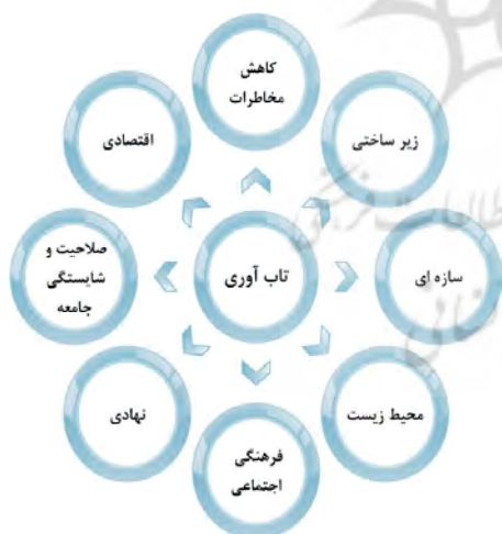
شکل شماره ۱: ابعاد تاب‌آوری [۷]

آنها سنجیده می‌شود. به منظور نشان‌دادن کاربرد شاخص تاب‌آوری دو حالت به عنوان مثال را فرض می‌شوند. در منطقه A برآورد شده است که زیرساخت حمل و نقل به میزان ۴۵ درصد در برابر زلزله تاب‌آور است و تأثیر وجود بیمه ۳۵ درصد است. با صرف هزینه X تاب‌آوری زیرساخت حمل و نقل به ۵۵ درصد و تأثیر وجود بیمه ۸۰ درصد و با صرف هزینه Y تاب‌آوری زیرساخت حمل و نقل به ۸۰ درصد و تأثیر وجود بیمه ۴۵ درصد رسیده است. براین اساس با محاسبه شاخص تاب‌آوری پیشنهاد شده، حالت X به میزان ۱۳ درصد و حالت Y به میزان ۳۰ درصد تاب‌آوری کلی شهر را افزایش می‌دهند. لذا با در نظر گرفتن هزینه اجرای استراتژی‌ها و میزان بهبود تاب‌آوری می‌توان استراتژی بهینه را برای افزایش تاب‌آوری شهری به دست آورد.