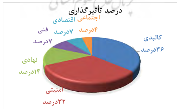
شکل شماره ۳: درصد تأثیرگذاری ابعاد در تاب‌آوری شهری