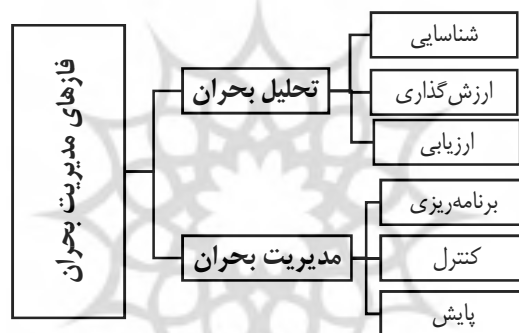
شکل شماره ۱: فازهای مدیریت بحران [۴]

فشرده‌گی، ریزدانگی، درصد بالای فضا‌های ساخته‌شده (توده‌های ساختمانی) نسبت به فضا‌های باز و تراکم جمعیتی در کنار آسیب‌پذیری، فرسودگی و ناکارآمدی تأسیسات و زیرساخت‌های شهری، بناها، خیابان‌ها و دسترسی‌ها در بافت‌های مسأله‌دار شهری بر وسعت خرابی‌ها و تلفات انسانی در زمان وقوع بحران می‌افزاید. متأسفانه امروزه بخش‌های وسیعی از بافت‌های تاریخی شهرهای ایران در زمره بافت‌های مسأله‌دار و ناکارآمد شهری طبقه‌بندی می‌شوند. بافت‌هایی با هویت و متمایز که هرچند منعکس‌کننده ارزش‌های فرهنگی تاریخی شهرها