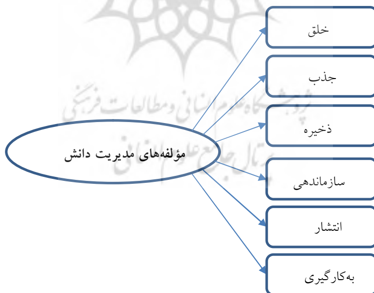
شکل شماره ۱: مدل ارائه شده توسط شرون لوسون (۲۰۰۳)

برای تعیین مؤلفه‌های مدیریت دانش در پژوهش از مدل شرون لوسون که متغیر مدیریت دانش را مشتمل بر شش مؤلفه خلق، جذب، سازماندهی، ذخیره، انتشار و به‌کارگیری دانش می‌داند، استفاده گردیده است.